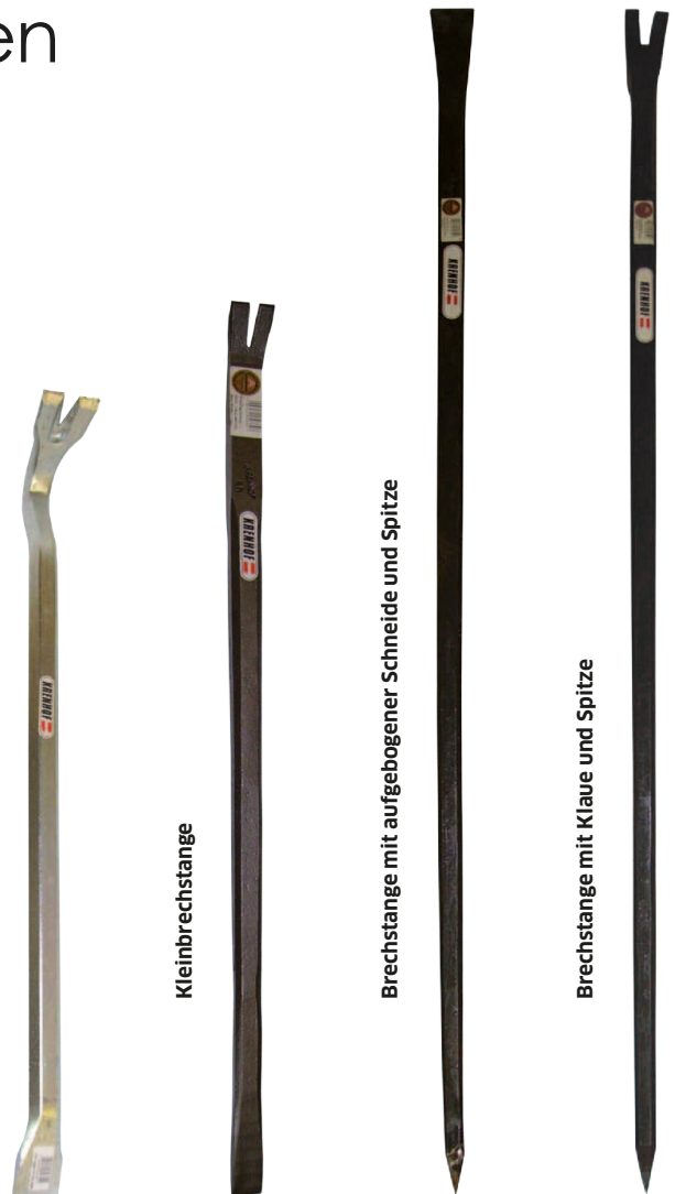
Brechstange mit Klaue und Spitze