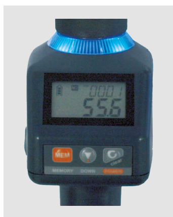
Blaue LED leuchtet: Soll Drehmoment erreicht.