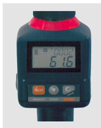
Gelbe und rote LED blinken: Überdrehungswarnung