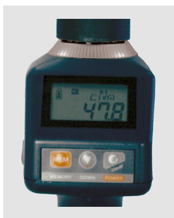
Weißer LED leuchtet: Annäherung an 80% des Soll Drehmoments.